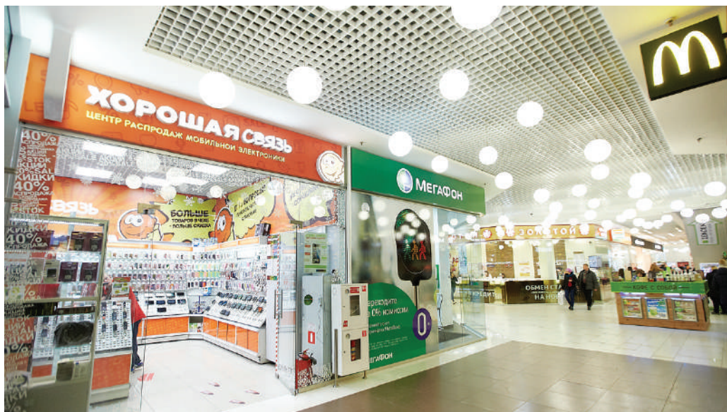
ТРЦ «Макси», Петрозаводск