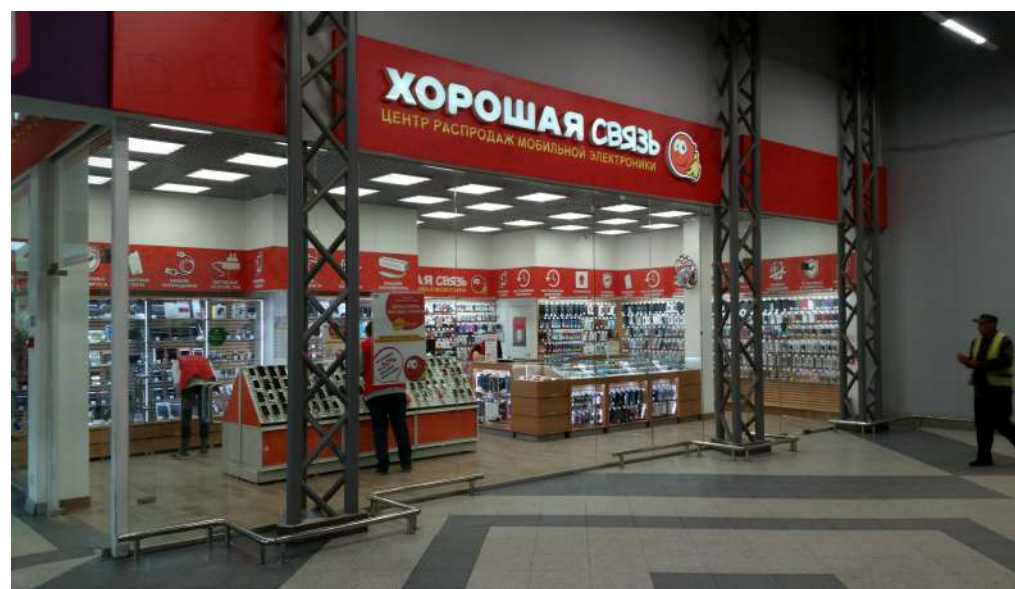
ТРЦ «Космопорт», Самара