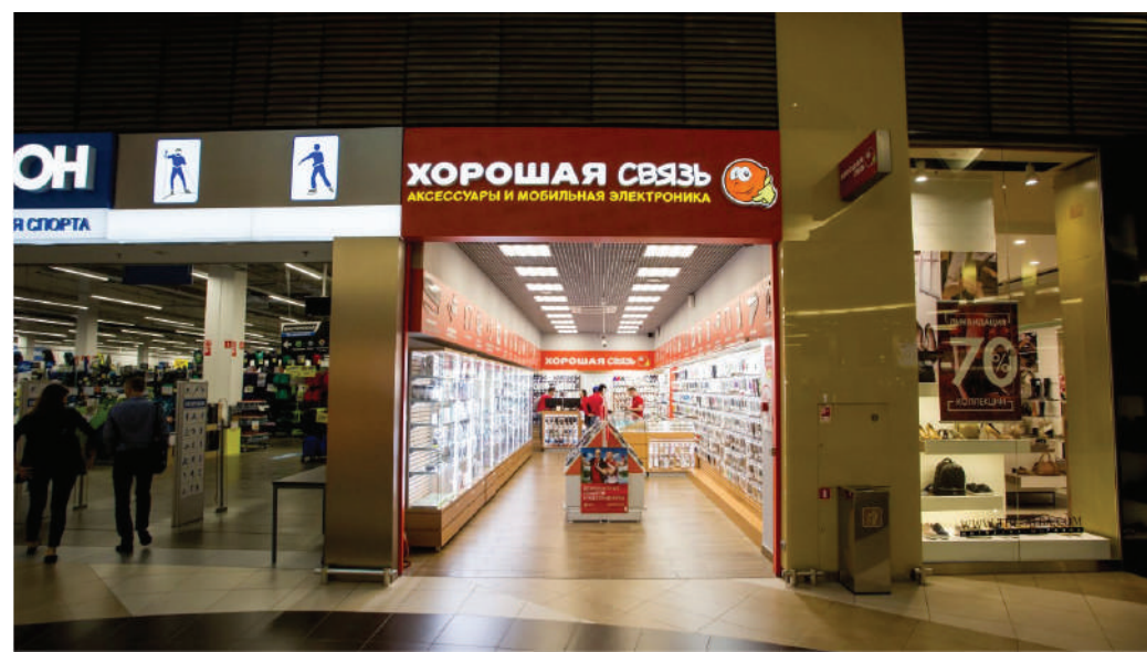
ТРЦ «Лето», Санкт-Петербург