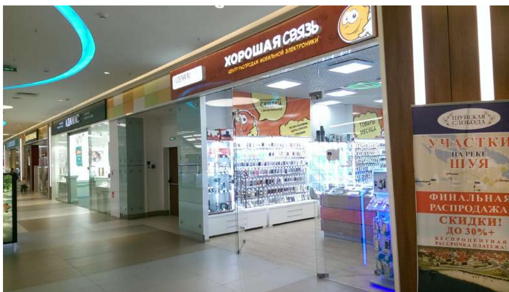
ТРЦ «Лотос-Plaza», Петрозаводск