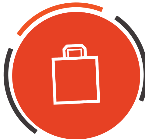
ИНТЕРНЕТ - МАГАЗИН