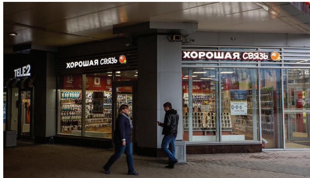
ст. метро «Купчино», Санкт-Петербург