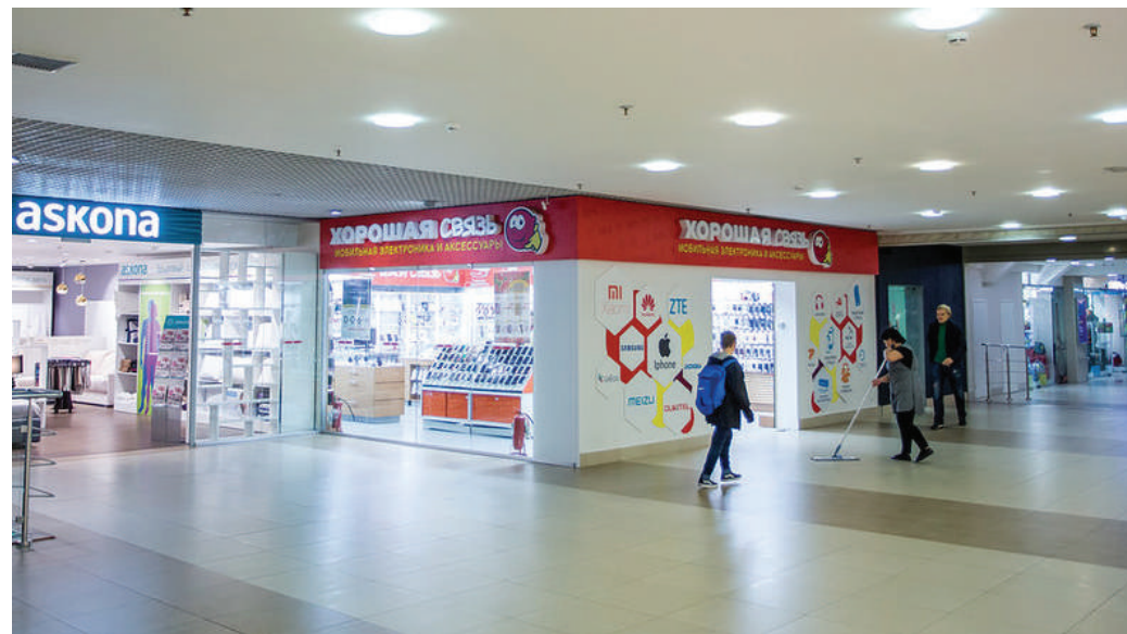
ТРЦ «Континент», Санкт-Петербург