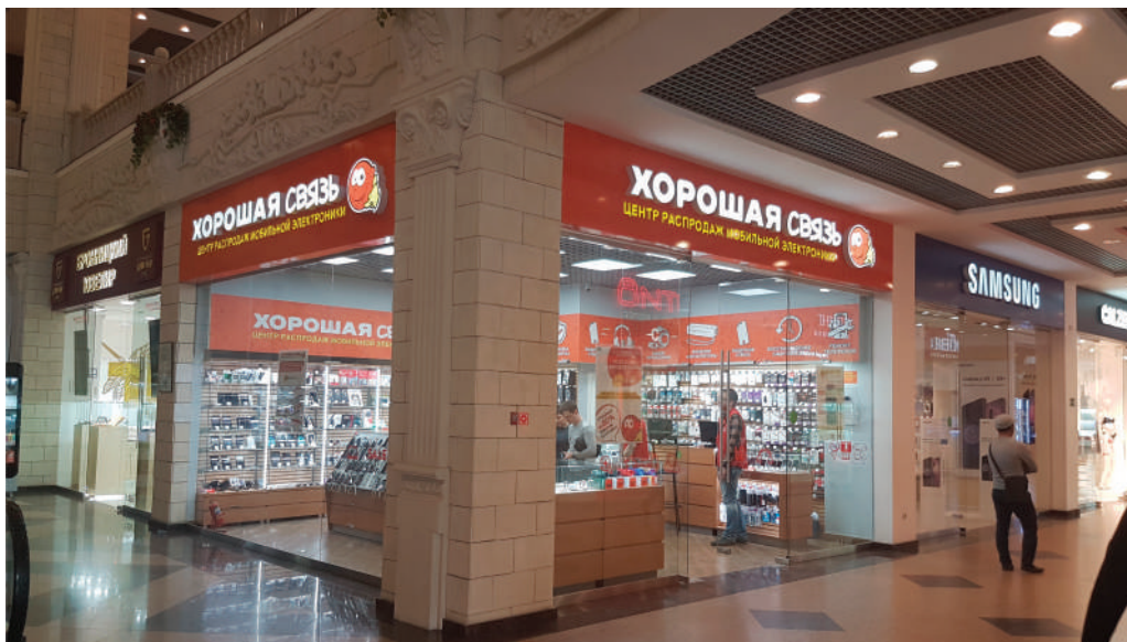
ТРЦ «Европа», Липецк