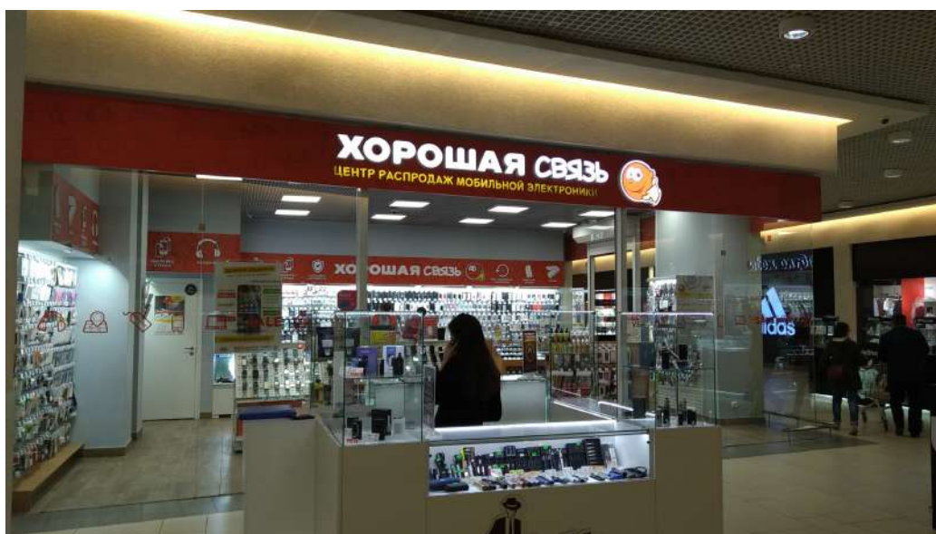
ТРЦ «Jam Молл», Киров