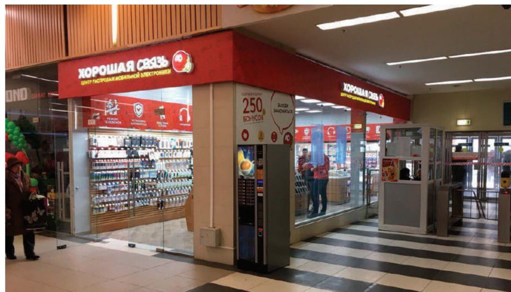
ТПУ «Планерная», Москва