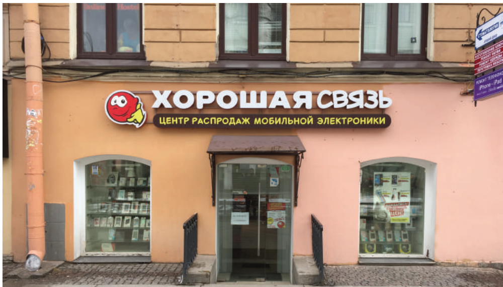
ст. метро «Василеостровская», Санкт-Петербург