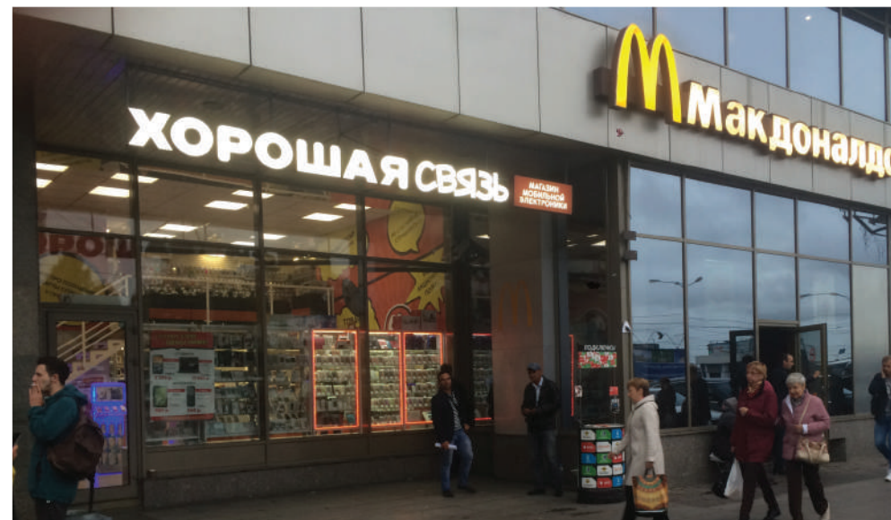
ст. метро «Площадь Александра Невского», Санкт-Петербург