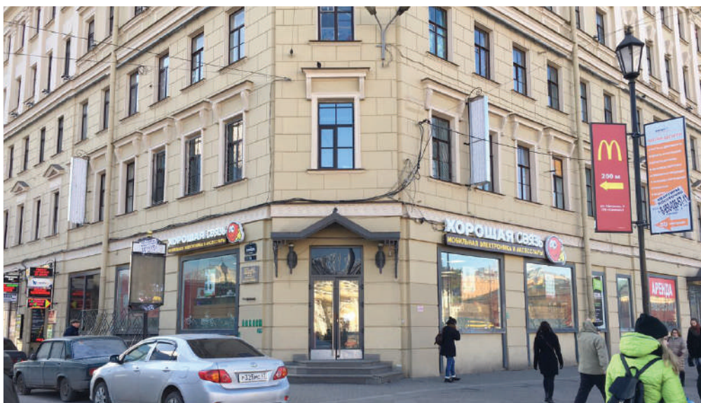
ст. метро «Сенная», Санкт-Петербург